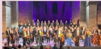
Aufführung 11. August 2021

Fr, 02. September 2022 BO-Probe, Aufführung 20:00 Uhr Bad Hersfeld