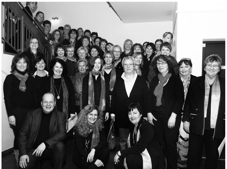
Frauenreferentinnen und Projekt-Frauenchor in Fulda am 10. 3. 2012