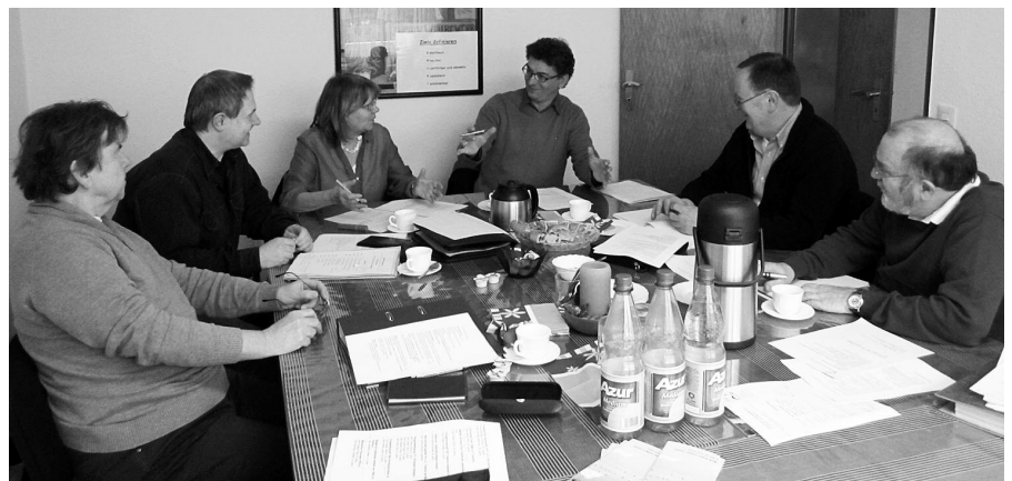
Die Vorbereitungen für das Deutsche Chorfest laufen auf Hochtouren.

In einer Zeit, wo bundesweit der Männerchorgesang rückläufig scheint, kann Hessen noch auf eine große Anzahl leistungsstarker, großer Männerchöre blicken. Dies zeigte zuletzt der Deutsche Chorwettbewerb in Dortmund, an dem in der Kategorie „Große Männerchöre“ drei von sechs Teilnehmern aus Hessen kamen.