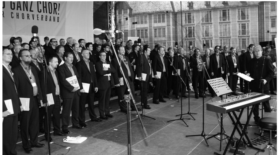
Auf der Bühne