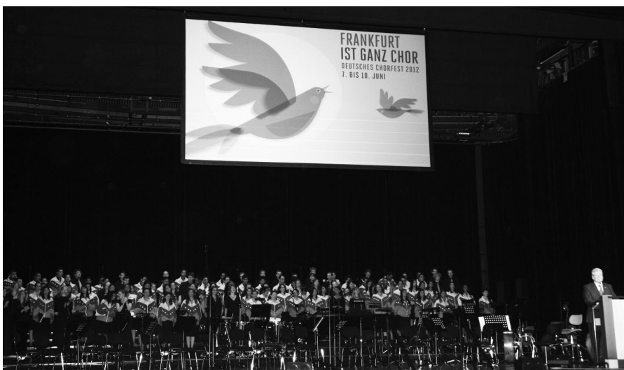
Eröffnung in der Jahrhunderthalle

Rückblick über das Deutsche Chorfest mit vielen Fotos, Links zu Presseartikeln und Stimmen von Teilnehmern unter www.hessischer-saengerbund.de