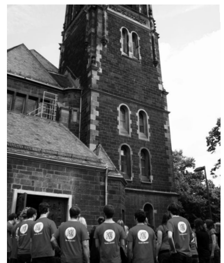
Ausklang mit dem Deutschen Jugendkammerchor