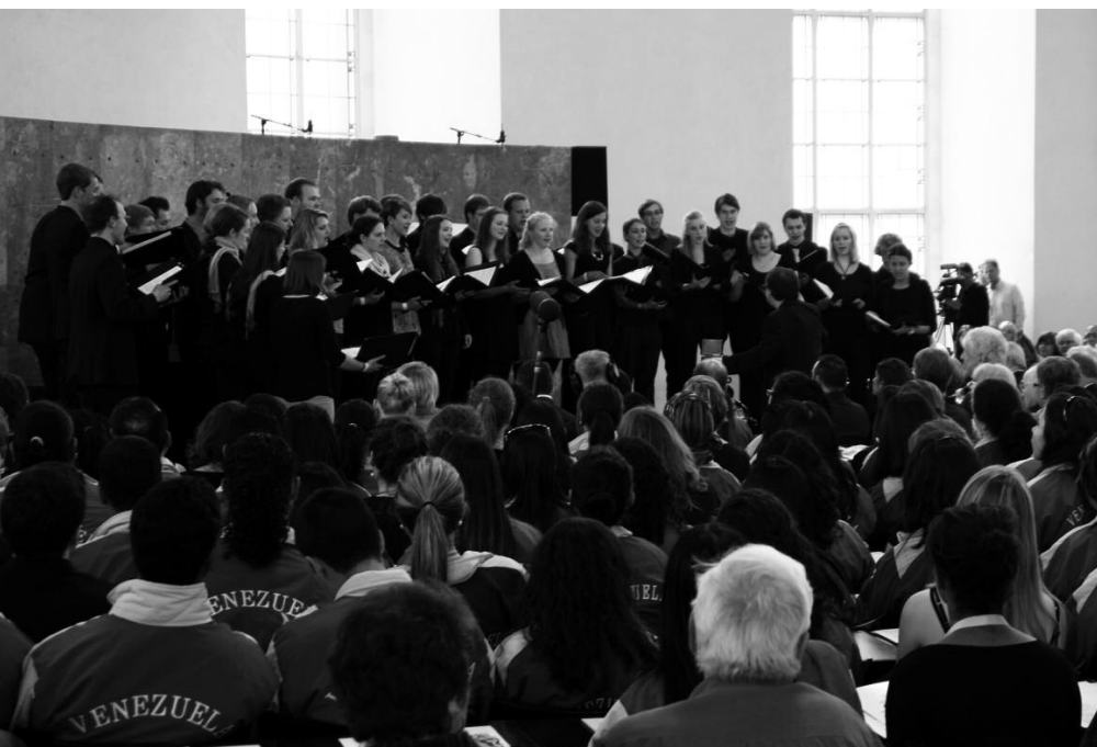
„Es wohnt ein Fiedler“

Parallel dazu fand in der Alten Oper das Eröffnungskonzert des Chorfestes mit dem RIAS-Kammerchor statt. Live in hr2-Kultur übertragen und von Dr. Andreas Bomba moderiert, erklangen Werke, die in den 150 Jahren der Chorverbandsgeschichte entstanden. Dabei lag der Schwerpunkt auf Geistlicher Musik. Der RIAS-Kammerchor erwies sich dabei als ein Chor, bei dem die