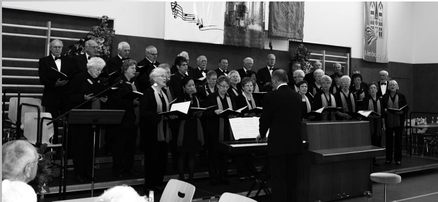
Der Männer- und Frauenchor Mensfelden am Festabend in der Erich-Valeske-Halle. Der Männerchor zählt zu den ältesten Gesangsvereinen in unserer Heimat.

Festliche Chormusik mit befreundeten Chören auf hohem Niveau in der Erich-Valeske-Halle