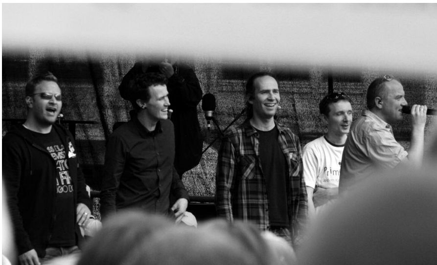
Strahlende Wise Guys im Regen