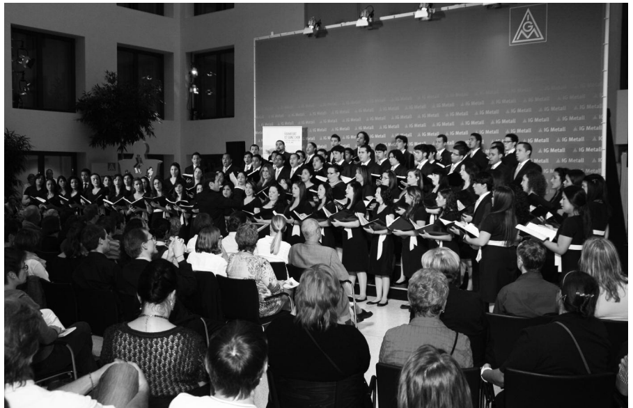
Sinfonischer Jugendchor Simón Bolívar