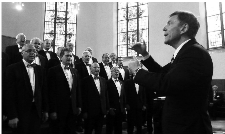
MGV „Sängerbund“ Dehm