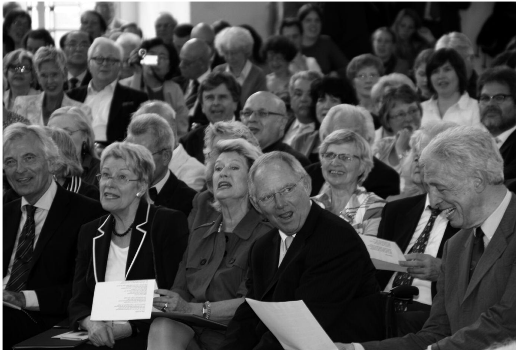
„Sing mal wieder“