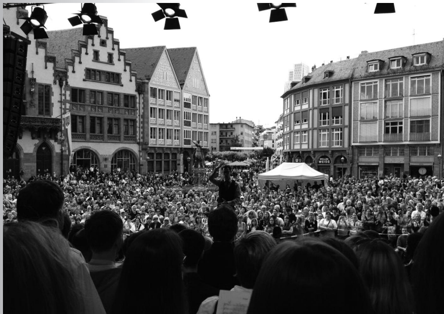
Auftritt auf dem Römerberg

sen und daraus ein Lied zu erfinden. Damit der Chor später mitsingen kann, erklärt er, wie sich die verschiedenen Musikrichtungen zusammensetzen. Doch die Harmonien alleine machen es nicht aus, auch die Haltung und die Art wie gesungen werde sind wichtig, um ein Feeling zu erzeugen. Am Ende rockten alle auf den Refrain „Ich hab Blumen im Klo, darum verstopft es so.“