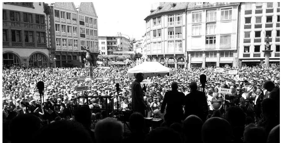
Vom Römerberg bis zur Paulskirche