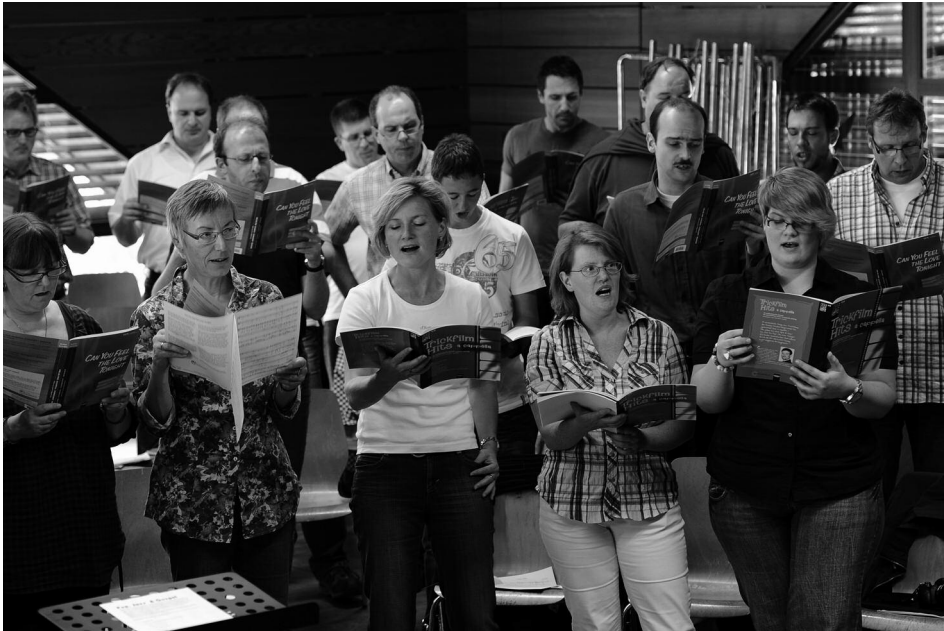
Aufmerksame Begeisterung beim Chorstudio im Musiksaal der St.-Lioba-Schule

damit es für niemanden langweilig werde. Und seine letzte Frage vor jedem Auftritt? „Warum machen wir das?“ - „Weil es Spaß macht!“