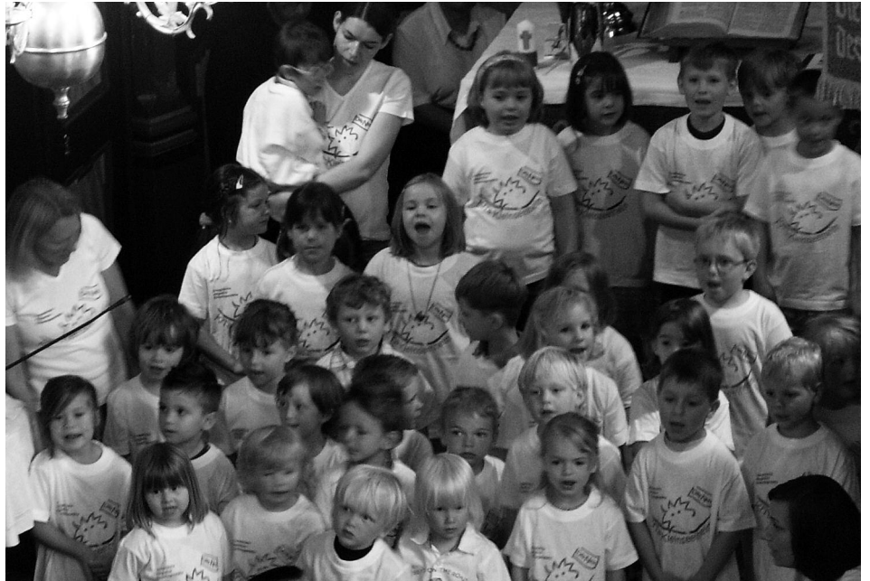
Kinder der KiTa Kleinseelheim beim Singen während des festlichen Gottesdienstes mit Felix-Verleihung in neuen T-Shirts.