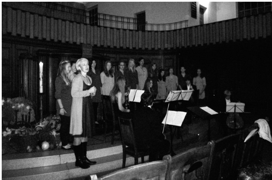
La Capella Junior Friedrichsdorf

Es wurden bei weitem nicht alle bemerkenswerten Stücke oder Leistungen aufge-